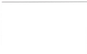
T-52 ミルキーホワイト [透光率:12.9%]