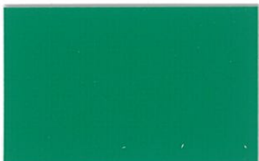
T-07 グリーン [透光率:0.1%]