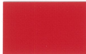
T-13 レッド [透光率:0.7%]