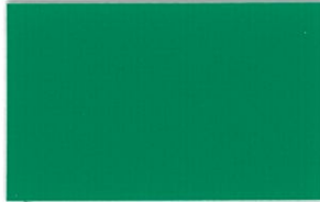
T-09 フォレストグリーン [透光率:0.2%]