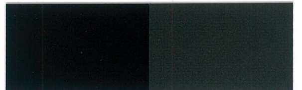
T-20 ブラック [透光率:0%]