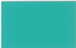
T-04 エメラルドグリーン [透光率:0.2%]