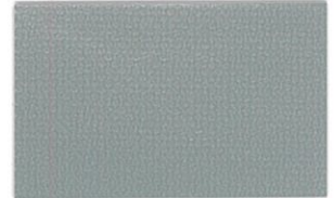
T-21 シルバー [透光率:0%]